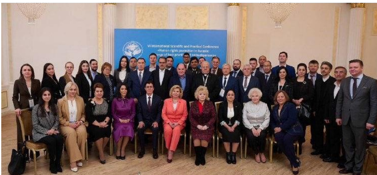
Участники VI Международной научно-практической конференции «Проблемы защиты прав человека на евразийском пространстве: обмен лучшими практиками омбудсменов» г. Москва, 2022 г.