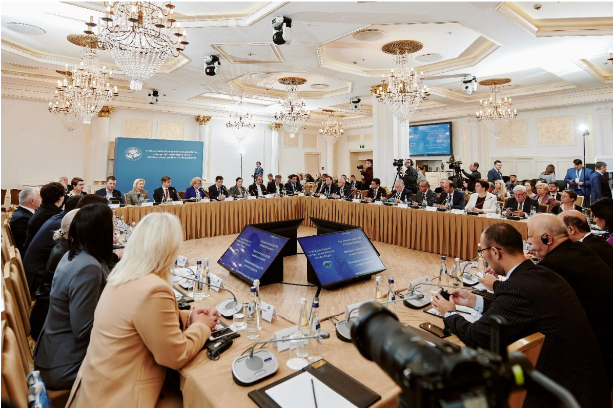
Участники VI Международной научно-практической конференции «Проблемы защиты прав человека на евразийском пространстве: обмен лучшими практиками омбудсменов»