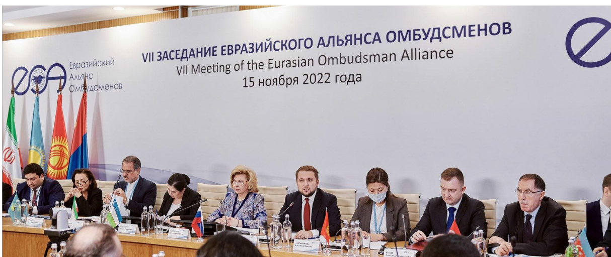
Участники VII заседания Евразийского Альянса Омбудсменов г. Москва, 2022 г.