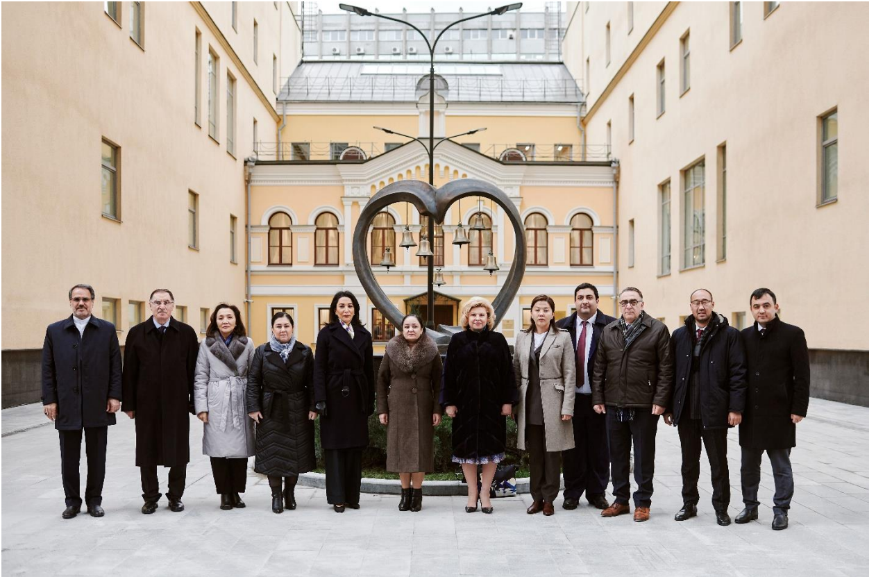
Участники VII заседания Евразийского Альянса Омбудсменов.